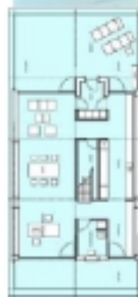
Drawings of ground floor and 1 st floor.